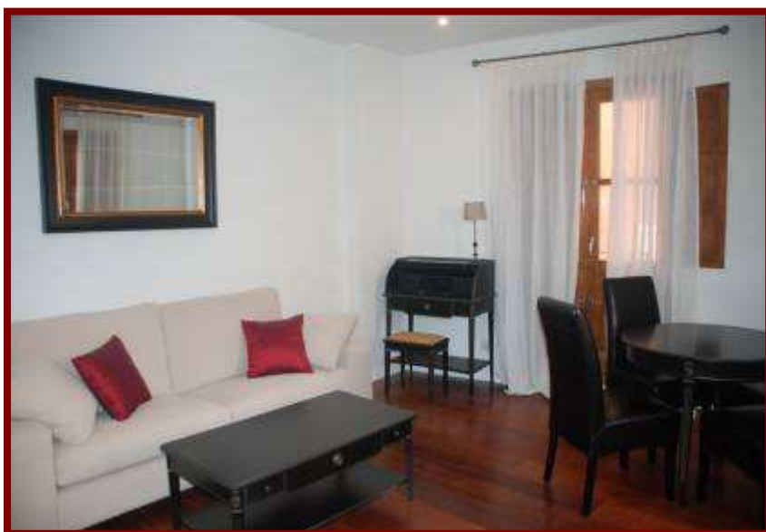
Salón principal de apartamento de dos habitaciones.