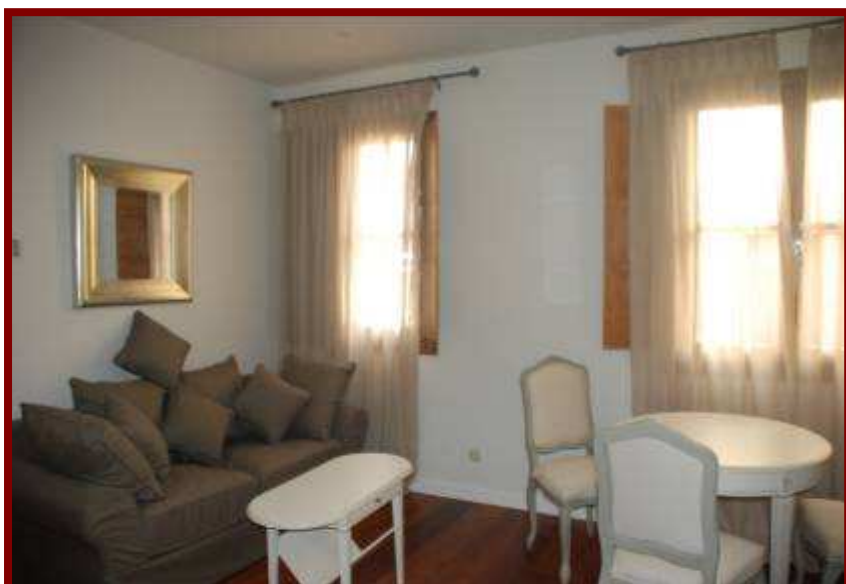
Salón de apartamento de una habitación.