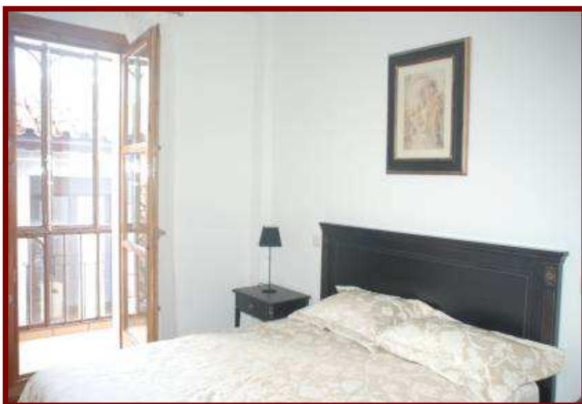
Habitación principal de apartamento de dos habitaciones con balconada.