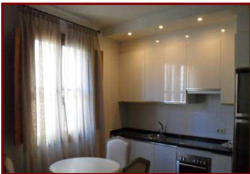
Cocina-Salón de apartamento de una habitación